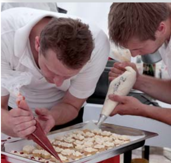
Perfektes Finishing in der Location (oben), ehe der charmante Service die Gäste verwöhnen kann.

Caramelis mit Himbeergelee und salzigen Milchcouverture-Blättern Cacaoflan auf Amaretto- und Espresso gelee mit Mascarpone sauce Lanxess „Magnum“ Grüntee Eis am Stil mit Chili-Schokoladenmantel Crema Catalana légère mit gebratener Ananas und Safran-Vanilleeis „Spiegelei“ - Mango-Verkapselung auf Buttermilchmousse