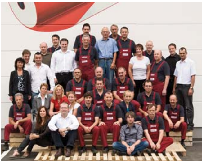
45 Mitarbeiter beschäftigt ASLAN heute – unter ihnen auch Experten für die Qualitätskontrolle (oben), die im hauseigenen Labor den Kleber auf Herz und Nieren prüfen.